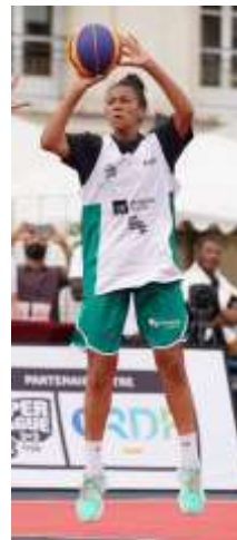
Logo sur le maillot et sur le short