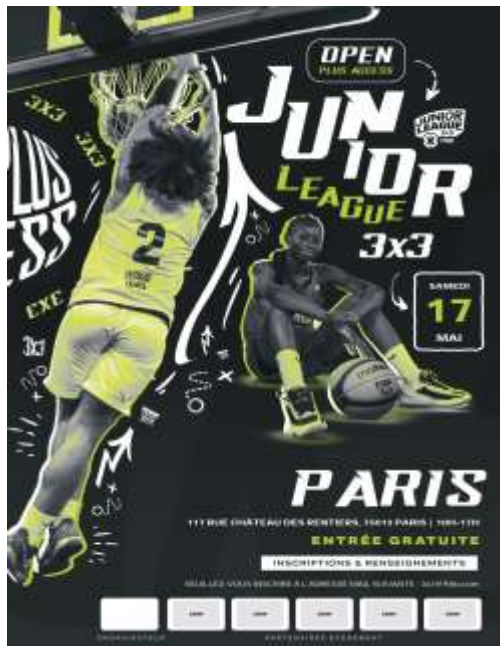
Affiches mise à disposition par la FFBB