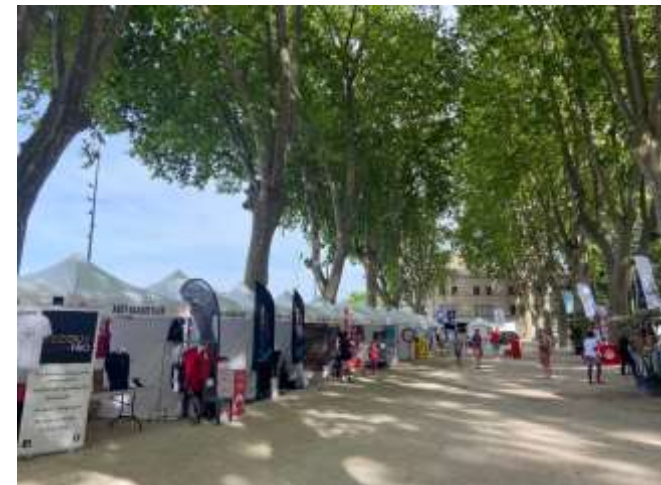
Stand sur le village