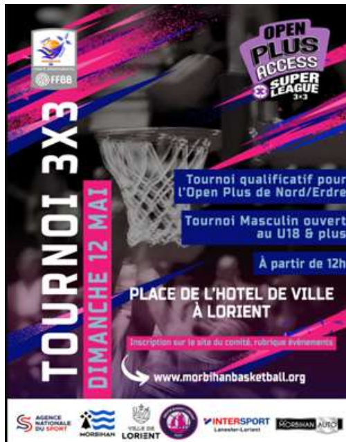
Exemple d'autres affiches